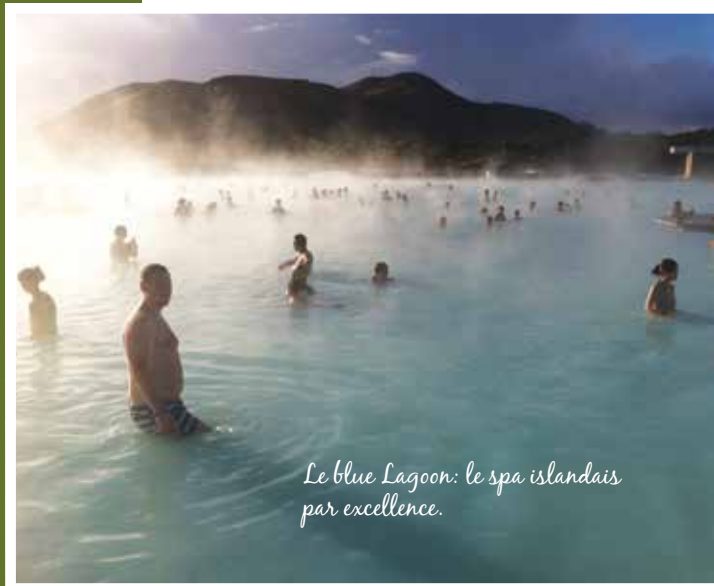
Le blue Lagoon: le spa islandais par excellence.