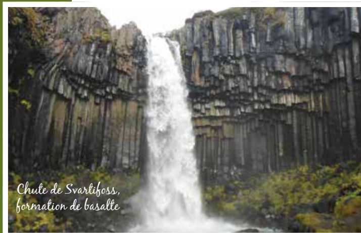
Chute de Svartifoss, formation de basalte

conferencevoyage.ca facebook.com/conferencevoyage.ca