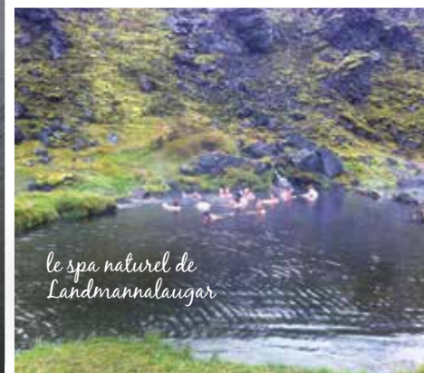
le spa naturel de Landmannalaugar