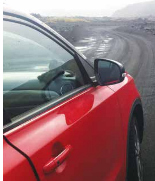
Sur la route à Landmannalaugar

Cette région n'est accessible qu'en 4x4. La route est défoncée et parfois barrée par de grandes mares d'eau. J'y ai accédé par la route F 208 qui semble-t-il, est la plus praticable en véhicule 4x4. Il pleut abondamment cette journée-là, mais je trouve la conduite vraiment agréable dans les grands espaces qui nous entourent. Après avoir traversé la nature aride, nous nous approchons des montagnes colorées de Landmannalauger qui se sont formées il y a des siècles. Plusieurs petites randonnées sont accessibles depuis cet endroit, mais malheureusement aujourd'hui la pluie tombe sans arrêt. Un incontournable : un bain thermal naturel où l'eau chaude rencontre